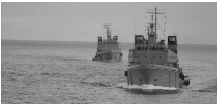
El AVPA y AVBA navegando en formación.

Demoramos en la carga 26 horas, es decir nuestro PIM ahora estaba ajustado, empezamos el cruce del Atlántico, que se dio con buen tiempo, el avance era sostenido, nos acercábamos a otro momento clave, el cruce del Ecuador. Pensaba en la historia de nuestra Armada y trataba de imaginar otra oportunidad en que cuatro buques nuestros hubieran cruzado el Ecuador juntos, integrando una fuerza. No hallé la respuesta, es posible que hayamos sido los primeros.