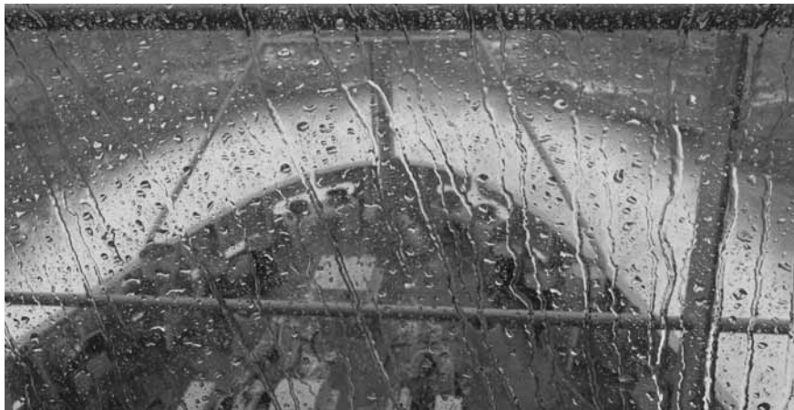
El amigable Mar de Noruega.

nudos. A esa altura de la navegación la meteorología sólo era una pequeña preocupación más, pues sabíamos y habíamos comprobado que los buques se comportaban de forma magnífica con mar gruesa. El litoral noruego nos había regalado un día de calma, pero los otros siete habían sido de mares encrespados, movimientos permanentes y la dificultad de llevar a cabo la rutina diaria en esas condiciones. Los manteles adherentes fueron exigidos al máximo para mantener la comida en la mesa. Todos los elementos móviles de cada camarote debían descansar cómodamente trincados en el piso, única superficie desde la cual ya no podían caer. Sin embargo ese mar nos hizo comprender la verdadera fortaleza de estos barcos. Sólo una tarde con vientos de más de 60 nudos de proa, tuvimos que caer unos grados el rumbo para recibir el mar por la amura y reducir la velocidad a 8 nudos para evitar golpear. Pese a ello, nuestra velocidad promedio de avance hasta la entrada al Canal Inglés fue de los estrictamente planificados y tercamente cumplidos 10 nudos.