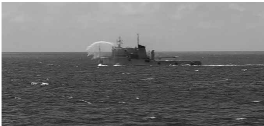
Cruzando el Ecuador.

el Ecuador a la hora deseada, navegando los cuatro buques en línea de frente al rumbo 180° arrojando agua por los monitores de incendio. Los cuatro atravesamos la latitud 0° formados en línea de frente de manera casi simultáneamente. Fuimos, creo, los primeros. Espero que se repita pronto y que otro grupo de buques de nuestra Armada realice un periplo parecido.