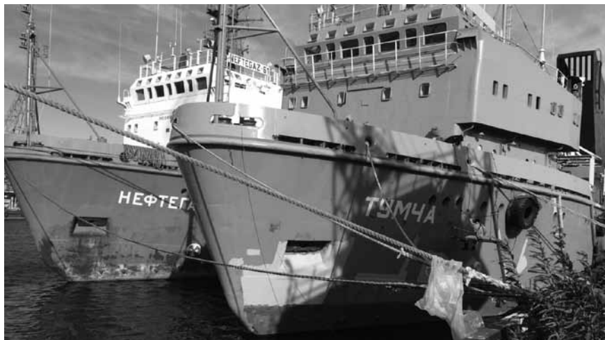
El TUMCHA (AVBA) a muelle, el NEFTEGAZ 61 (AVPA) en Arkhangelsk. Inicio de los trabajos.

Esa última estatua de bronce, muestra un lustre particular en su mando derecha y nariz. Dice la tradición lugareña que quien visita la ciudad, estrecha la mano del anciano y frota su nariz, alguna vez volverá. Ese fue mi caso. Como marino soy supersticioso, pero en este caso tengo motivos.