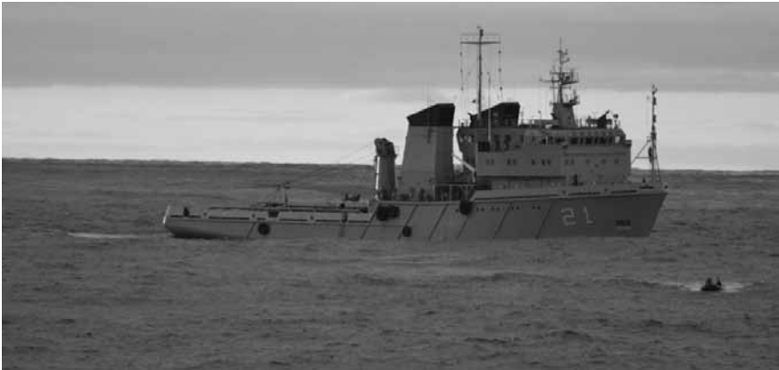
Una maniobra de botes, en algún lugar del Atlántico.

pasaje al habla, traspaso de cargas livianas, cambios de estación, etc. También maniobras de bote, para trasladar tripulantes, repuestos y cargas.