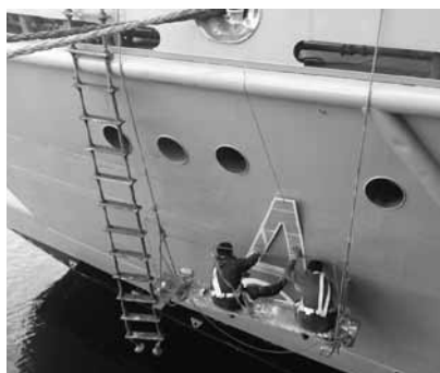
Pintando los números.