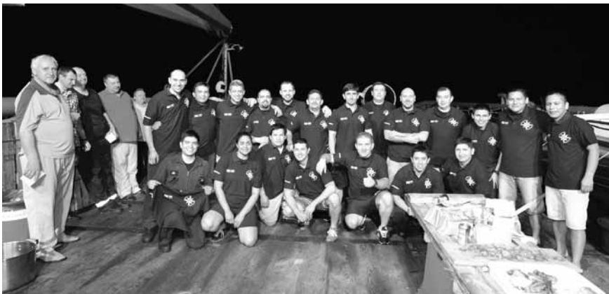
Una tripulación y un momento de distensión en el mar.

Algo similar ocurría con la necesidad de una prueba de máquinas previa a la zarpada, que dada las restricciones diplomáticas yo juzgaba imposible. Pese a ello mis subordinados me la requerían incluso con iniciativas como salir de los puertos rusos y tocar un puerto noruego para desembarcar especialistas, u obtener repuestos a través de la empresa contratista con enlaces en ese país. Todo ello lo veté por cumplir a rajatablas los plazos ordenados, pero también consciente de la falta de apoyo del vector diplomático.