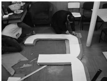
Creando los moldes de los números.

También había que convertir locales en cámara de oficiales, reformar camaretas, adaptar alojamientos, todo ello se hizo a pulmón, hubo comandantes que alfombraron sus camarotes o colocaron ellos mismos piso flotante en los suyos, oficiales que armaban las facilidades de sus cámaras, nadie se lamentó, no hubo ofendidos, se trepaban a los palos y pintaban a la par de los cabos. Las mujeres lijaban y limpiaban a la par de los hombres. Se consolidó un grupo de tripulaciones fuera de serie.