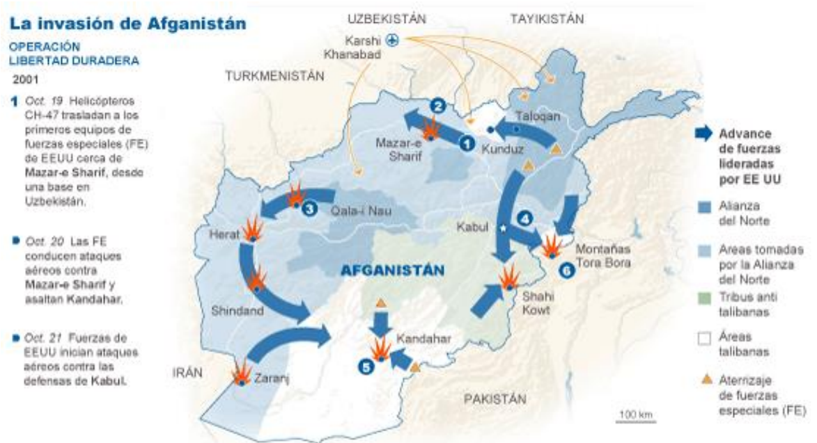
Figura 3: Mapa de Afganistán – Graficada las acciones iniciales de la Operación Libertad Duradera.