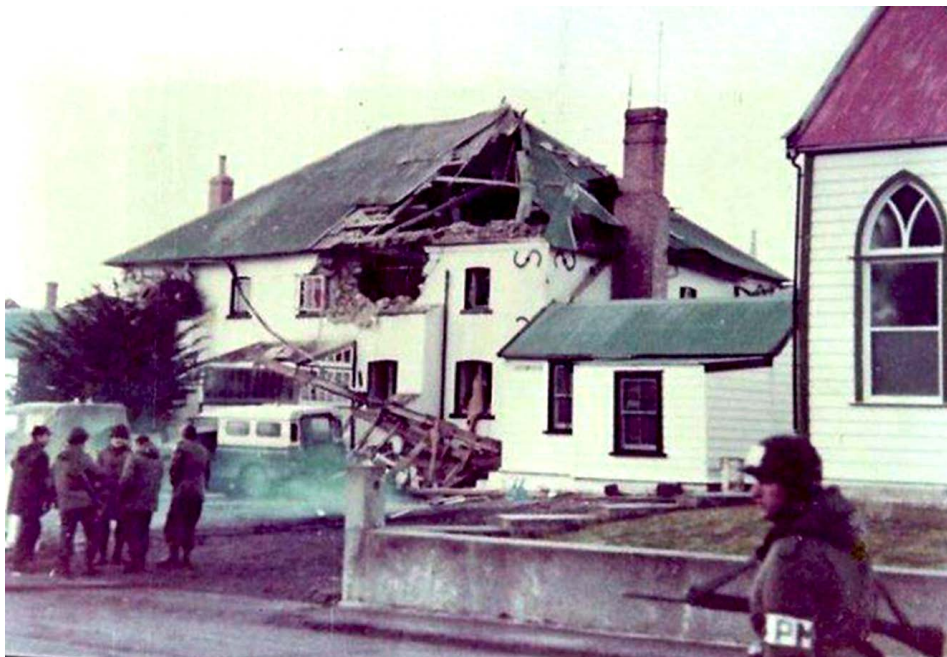
Frente de la Sección luego del ataque del 11 de junio de 1982