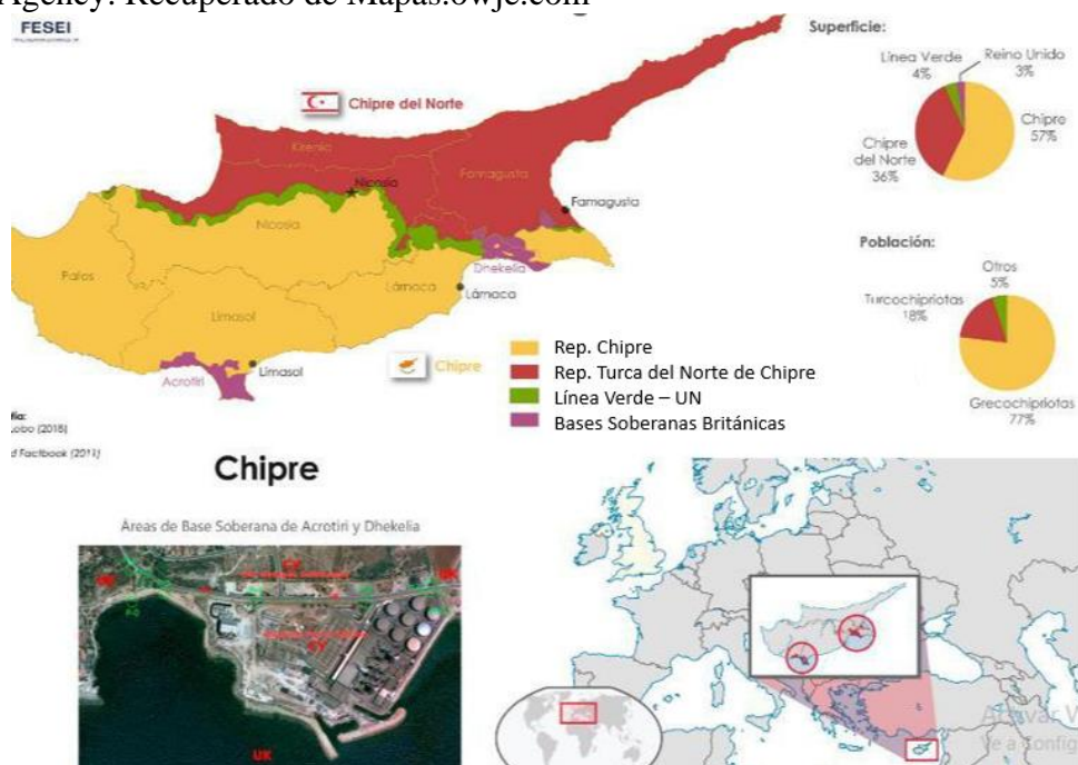
Situación Territorial y Bases del UK .

Como se observa, el espacio geopolítico que ocupa la isla de Chipre se encuentra en una zona en disputada entre Occidente y Oriente por siglos, y es una parte constitutiva del conflicto que mantiene Grecia y Turquía, en un marco geopolítico en donde es importante el rol que ocupa Turquía para Oriente y el de Grecia para Occidente. Oriente a través del islam