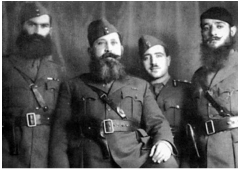
Alchetron. Napoleon Zervas comandante del EDES. Recuperado de: https://alchetron.com/Napoleon-Zervas

Una excepción a este criterio de división entre las organizaciones armadas griegas fue la llamada “Operación Animals”, en donde el servicio de inteligencia británico llegó a un acuerdo con los dos grupos guerrilleros más importantes, para ejecutar de manera conjunta a partir del 21 de Junio de 1943, operaciones de sabotaje a lo largo de todo el territorio, con el apoyo de la aviación aliada, en esta oportunidad, los dos comandantes, Zervas y Velouchiotis, condujeron las operaciones junto con el jefe de británico de la misión de operaciones especiales en Grecia (SOE) Brigadier Eddie Myers, que acompañado también por tres integrantes más del grupo, incluido un griego, habían sido infiltrados en paracaídas el 29 de septiembre de 1942.