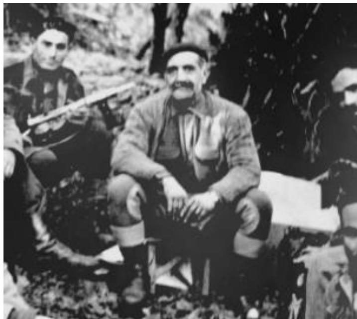
Cnl Grivas en las Montañas de Trodos

contra los ocupantes en inmediaciones de Atenas, una vez replegadas las tropas alemanas de Grecia, el Coronel Grivas combate junto a las tropas británicas contra las guerrillas comunistas a partir de 1944, liderando el rechazo de las ofensivas guerrillas comunistas del ELAS durante 1947. Ya finalizada la Guerra Civil Griega, se dedica a la política, tomando contacto con Makarios III la figura política más importante de Chipre y a partir de ahí se involucra en el futuro de Chipre dirigiendo la organización armada EOKA.