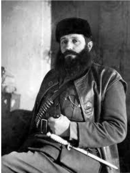
Aris Velouchiotis Comandante del ELAS.

Por otro lado , se organizaron, movimientos guerrilleros sobre la base de elementos residuales del Ejército Helénico, referentes políticos conservadores republicanos y monárquicos, estableciendo como organización armada principal de este movimiento la EDES-EOEA (Liga Nacional Greco Republicana – Agrupación Nacional de Guerrillas Griegas) comandada por el Coronel Napoleón ZERVAS, este movimiento conto con el apoyo del gobierno monárquico exiliado en Egipto y el gobierno británico, que rápidamente a través de una alianza se negociaron apoyos y como resultado de los mismos se orientó el esfuerzo no solo a rechazar las potencias de ocupación sino a quitar influencia a las guerrillas de izquierda, previendo futuros conflictos de poder con los mismos. Cabe señalar que las fuerzas de ocupación, en particular las alemanas, se concentraron en ejecutar operaciones psicológicas y de espionaje para acusar en uno y otro sentido de colaboracionistas o de pro rusos, para fragmentar y dividir la unidad de intereses en el combate contra las fuerzas del eje y desviar la atención hacia las hostilidades entre las mismas organizaciones guerrilleras.