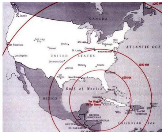
CIA, Misiles R12 de la URSS en Cuba