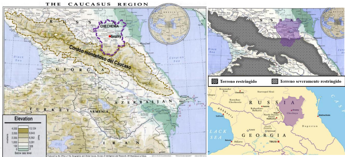
Figura 2 Región del Cáucaso

Nota: En color violeta, se visualiza la ubicación de la República de Chechenia.