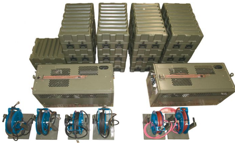
Figura 8. Estaciones de trabajo HIPPO 2042E, provista en el Centro de Mantenimiento e Instalaciones y Equipos de Ingenieros.

En el 2016 el centro adquirió unos equipos de origen estadounidense, que cumplen con todos los requisitos actuales de simplicidad, modularidad, adaptabilidad y sustentabilidad, para ser montados sobre cualquier tipo de vehículo y transportado al lugar donde se desee emplear. Consta de un cuerpo central, que es básicamente el generador de energía, el cual consta de salidas para sistemas eléctricos, hidráulicos y neumáticos, y dispone de una gran cantidad de herramientas manuales de alta tecnología capaces de emplear a requerimiento. Esto permite que, al haberse configurado una necesidad o emergencia, pueda armarse el módulo según lo necesario, y desplegado en poco tiempo junto con sus operadores en apoyo a la tarea.