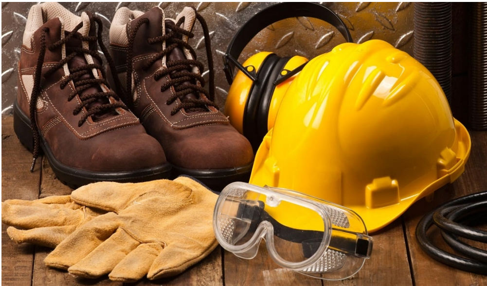
Figura 11. Equipo de protección personal. Fuente: kpnsafety.com/epp-para-seguridad-eléctrica . Año 2022.

Los equipos de protección personal (EPP) para electricidad son necesarios y obligatorios. Su función es proteger a los trabajadores cuando realizan determinadas actividades que ponen en peligro su vida. Incluyen una serie de elementos esenciales que ayudan a evitar los accidentes provocados por la exposición a la corriente eléctrica.