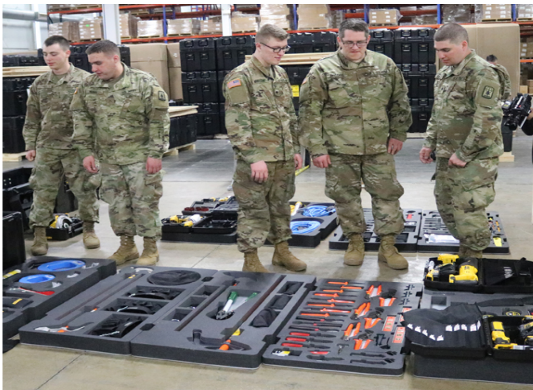
Figura 9. Estaciones de trabajo HIPPO 2042E y algunas de sus herramientas, provista en el Centro de Mantenimiento e Instalaciones y Equipos de Ingenieros.

Las estaciones de trabajo HIPPO 2042E son paquetes de energía autónomos y modulares, accionados por un motor diésel que proporciona múltiples fuentes de energía para uso continuo con una amplia variedad de herramientas manuales de servicio pesado.