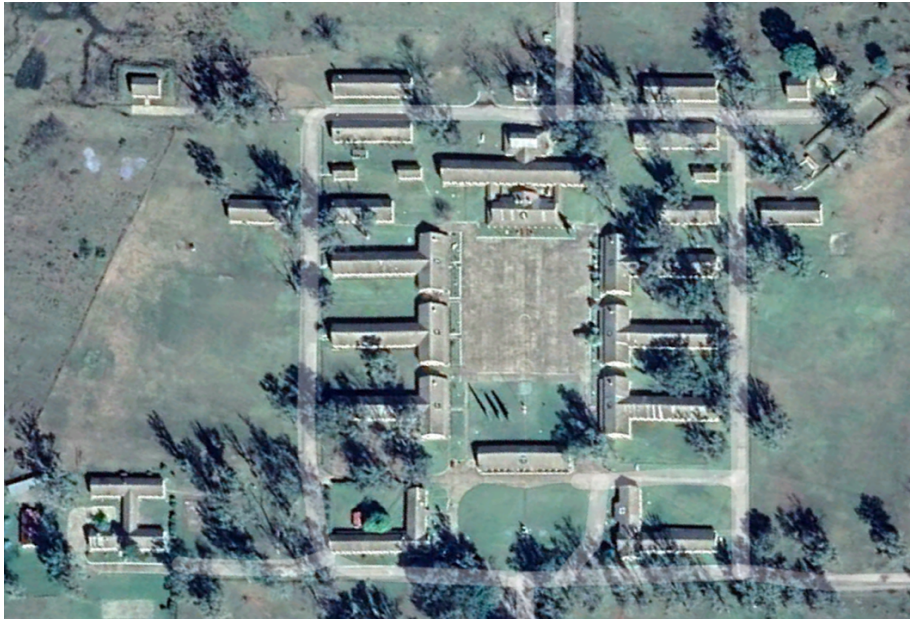
Figura 6. Gráfico de la ubicación y jurisdicción del RIMte 4 Monte Caseros. Construcción modelo económico 1940.