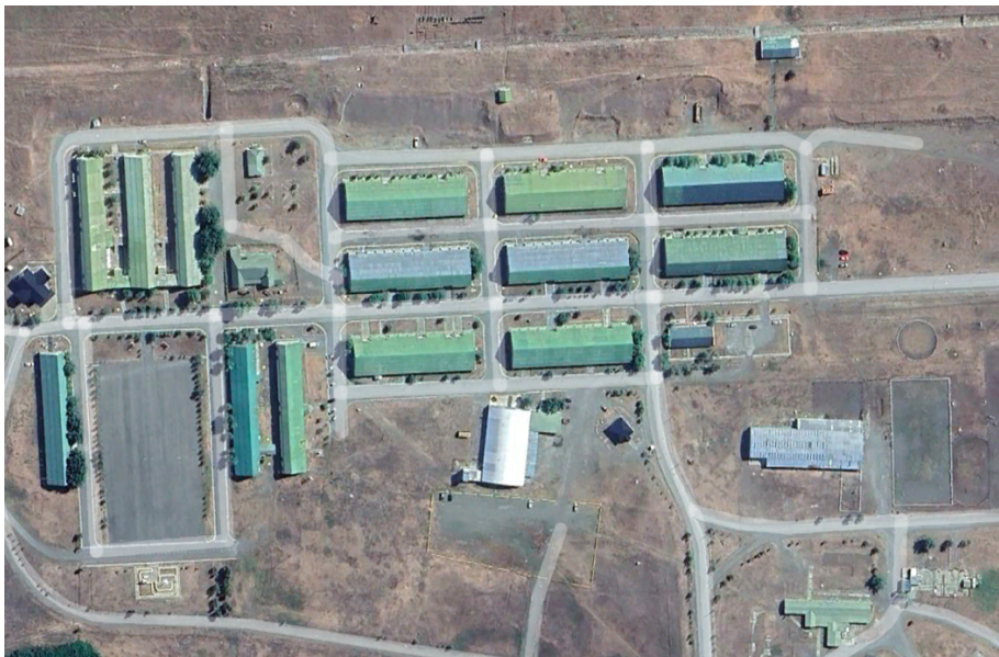
Figura 7. Gráfico de la ubicación y jurisdicción del RIMec 35 Rospentek. Construcción modular KORAX.

Según el Régimen Funcional de Construcciones (2006) la vida útil de una edificación, a nivel estructural es de 50 años, y a partir de allí se debe considerar la conveniencia de efectuarle mantenimiento o de construir uno nuevo. Teniendo en cuenta que las instalaciones