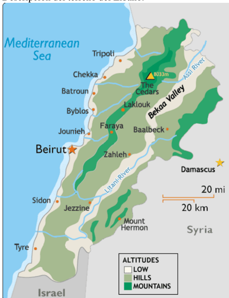
Descripción del terreno del Líbano. 133

Las principales acciones de las fuerzas terrestres tuvieron lugar al sur del río Lítani, en un frente de aproximadamente 40 km por 10 km de profundidad. Las acciones sobre Beirut fueron realizadas por la Fuerza Aérea y en el valle de Bekaa actuaron las fuerzas especiales interdictando las vías de comunicaciones con Siria.