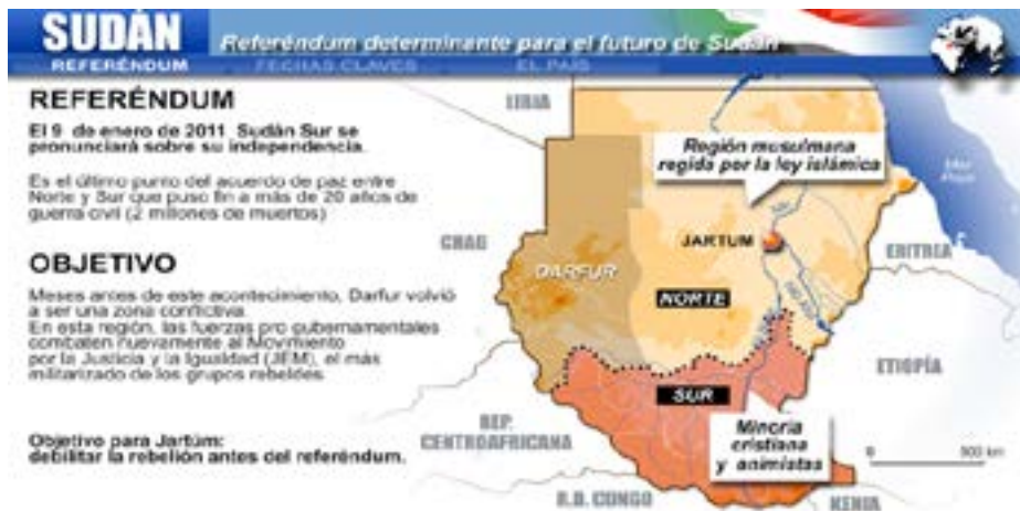
Figura 1: División religiosa y cultural del Sudán