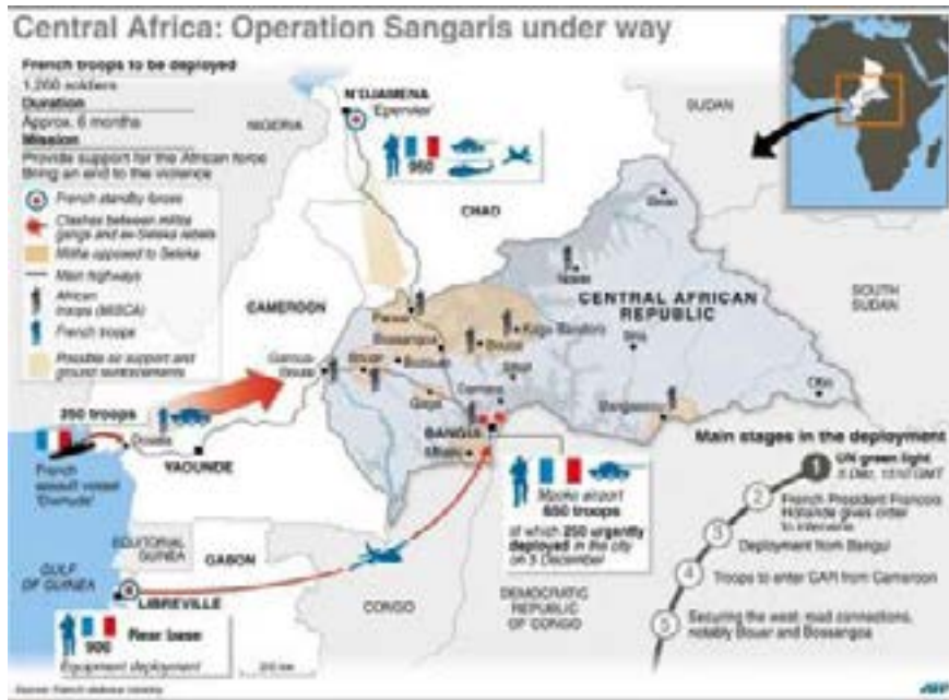
Figura N° 3: Despliegue inicial francés en la Operación Sangaris