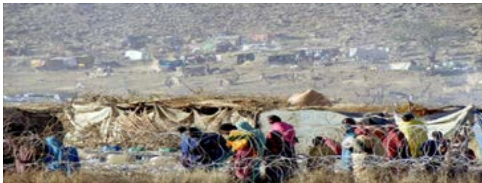
Figura 4: Refugiados en Sortoni, Darfur del Norte