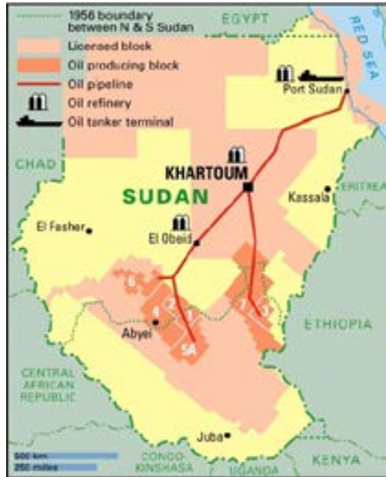
Figura 2: Mapa del petróleo en Sudán.

Fuente: Instituto Sudamericano de Política y Estrategia (ISAPE) 4