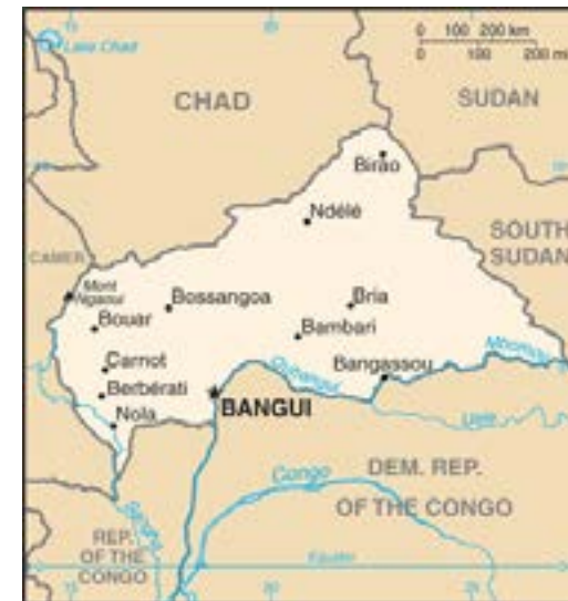
Figura N° 1: Ubicación general y particular de la RCA.