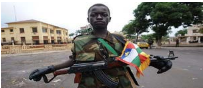
Figura N° 2: Niños soldados en la RCA

La crisis del 2012 y el poderío de estas organizaciones provocan que el presidente Bozizé convocara a una ronda de conversaciones de paz en Enero del 2013, donde se compromete a nombrar en su gabinete a un primer ministro opositor e incorporar a varios rebeldes en su administración.