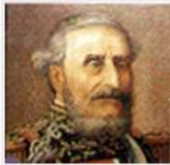
Juan Esteban Pedernera

Pavón tuvo un resultado decisivo, al dejar inerte a la Confederación. Ello no ocurrió precisamente por la destrucción de sus fuerzas en la batalla sino por la retirada y dispersión que fueron sus consecuencias, así como por la pérdida de material de guerra de muy difícil reposición.