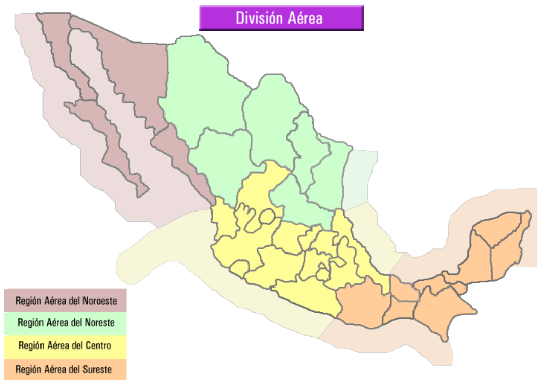
Figura 3: Regiones Militares de Fuerza Aérea en México 21