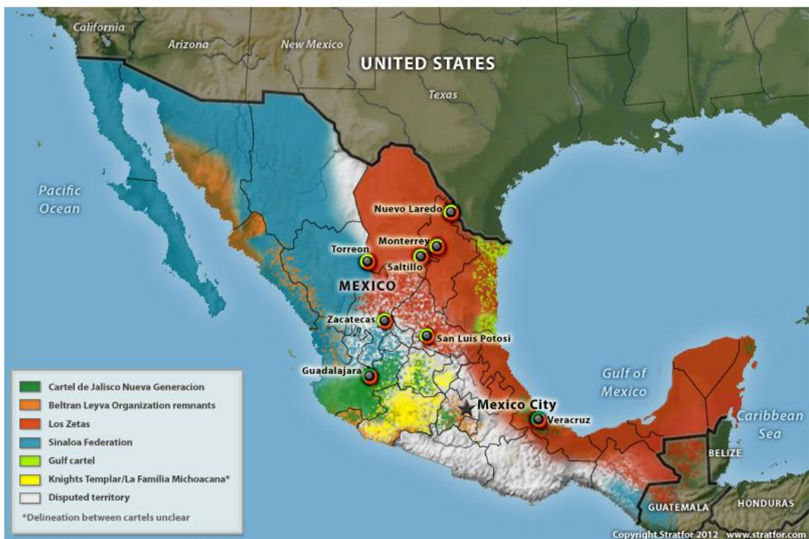
Figura 1: Cárteles de la droga en México 14

En general, las actividades de estos grupos son la producción, transporte y distribución de cocaína, marihuana, heroína y metanfetaminas, consolidándose también en actividades como el tráfico de personas; trata de blancas; contrabando de maderas finas y piedras preciosas; secuestro; robo de combustibles y robo de autos; piratería; extorsión y cobro de piso; homicidios y violaciones, además de la cooptación de personas para su causa; amenazas a la población civil y corrupción de funcionarios públicos, agentes policiales y personal de las Fuerzas Armadas, entre otros. Al respecto, la incorporación de ex-militares con entrenamiento de fuerzas especiales (especialmente en el cártel de Sinaloa) llevó la violencia niveles sin precedente.