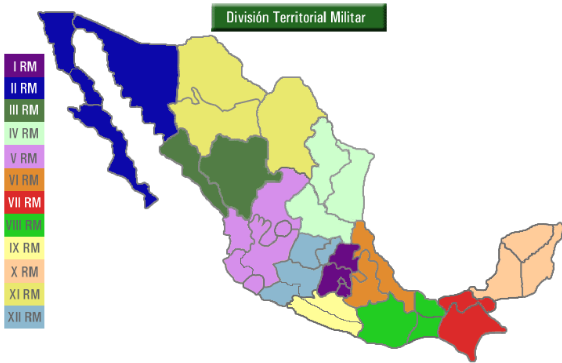
Figura 2: Regiones Militares de Ejército y fuerza Aérea en México 20