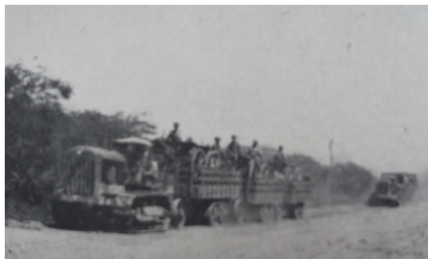
Maquinaria utilizada en la guerra para abrir y adaptar caminos. Notas sobre la pasada guerra del Chaco

En referencia a la guerra mecanizada y motorizada, el mayor del Ejército Argentino Juan Esteban Vacca, integrante de la Comisión Militar de Neutrales al final del conflicto chaqueño, resaltó el uso de camiones, automóviles, tractores y aplanadoras durante la contienda. Señaló que el servicio de choferes debía ser, en tiempo de paz, motivo de cursos o de instrucción especiales y que «los conductores paraguayos resultaron más hábiles y minuciosos para el cuidado y la conservación de sus vehículos; era “cuestión de honor” llegar a destino con seguridad, rapidez y estar en condiciones de un regreso imprevisto» 20 .