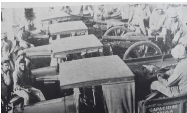
Transporte de armamento en camiones. Notas sobre la pasada guerra del Chaco