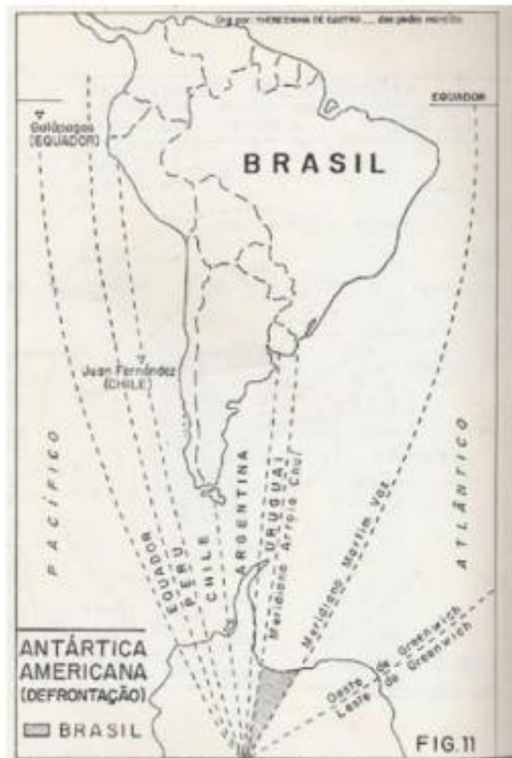
Figura 5: Propuesta de división de la Antártida