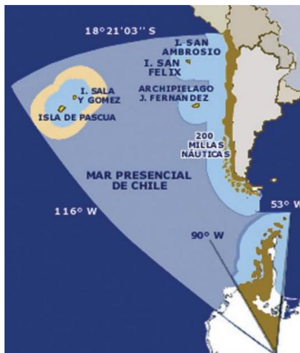
Figura 3: Mar Presencial de Chile