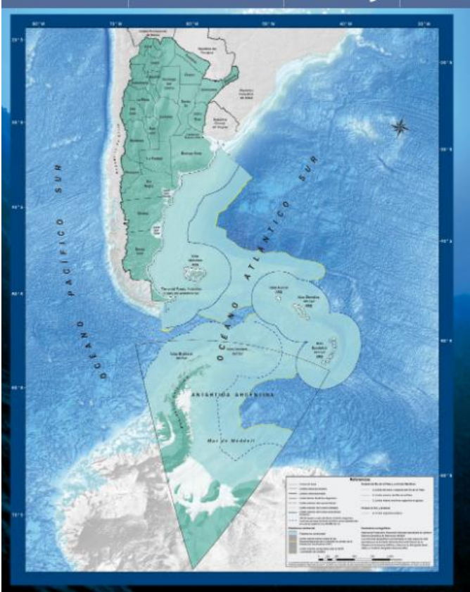
Figura 4: Mapa de los espacios marítimos de la República Argentina.