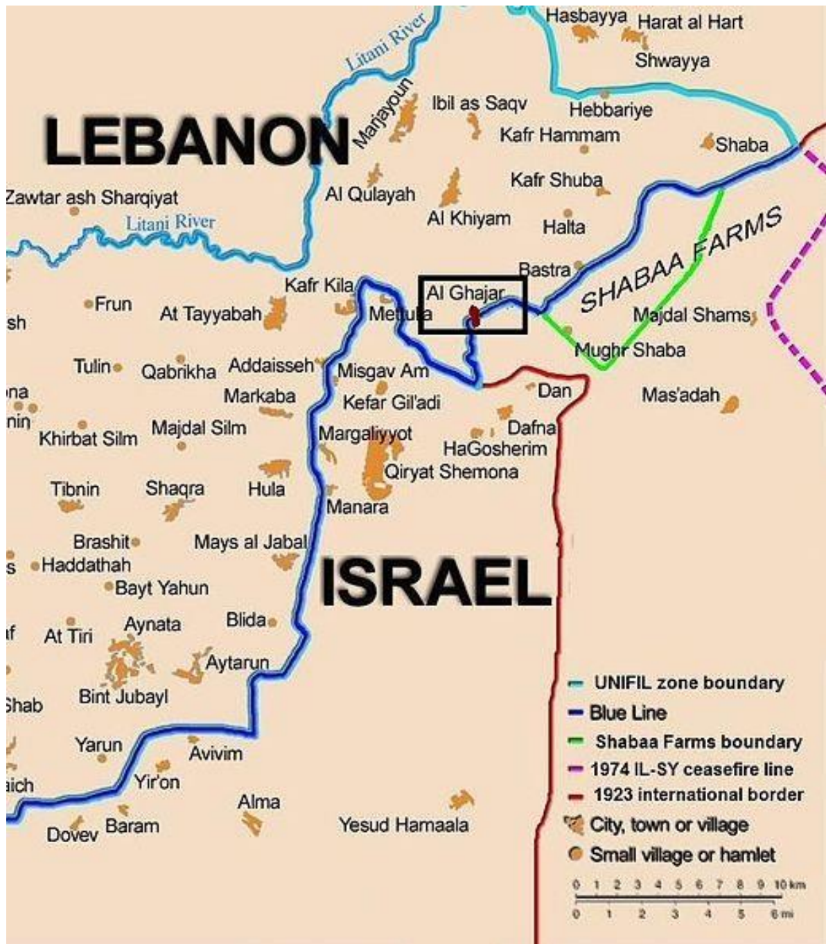
Imagen sacada de internet ( https://nl.wikipedia.org/wiki/Bestand:Ghajar_highlighted.JPG ) y modificada por el autor.