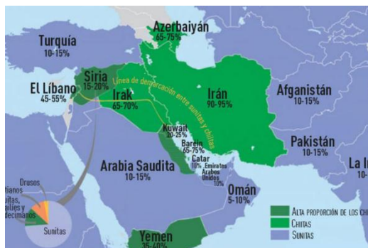
(Russian Today, 2015)

El conflicto del Yemen está sumergido dentro de la disputa entre sunitas y chitas en el mundo islámico, sobre todo la península Arábiga, donde se hayan las áreas sagradas del islam, que coincide con las áreas de riquezas petroleras, sumado a la importancia geopolítica de los estrechos de conexión marítima que vinculan a los actores internacionales con la región.