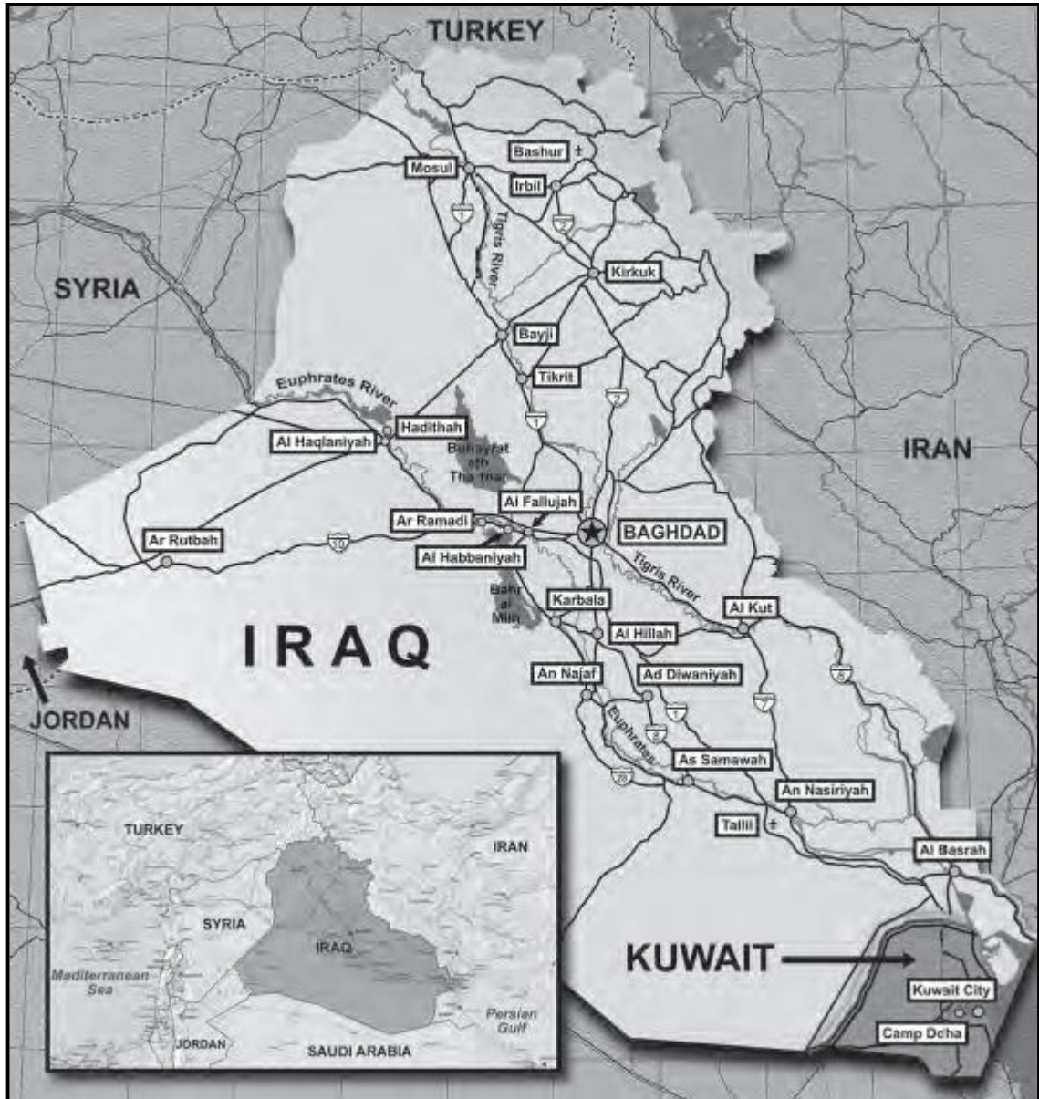
Gráfico 1: Ambiente geográfico. Límites de Irak. Principales ciudades y carreteras.