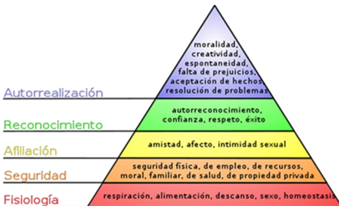
Cuadro Nro 1 - Pirámide de MASLOW.

Si nos posicionamos en el cuarto nivel - Reconocimiento, nos encontramos con las necesidades de estima, Maslow describió que una estima baja concierne al respeto de las demás personas, como la necesidad de atención, aprecio, reconocimiento, reputación, estatus, dignidad, fama, gloria, e incluso dominio. El incremento de estas necesidades se refleja en una baja autoestima y el complejo de inferioridad. (Chiavenato, 2011).