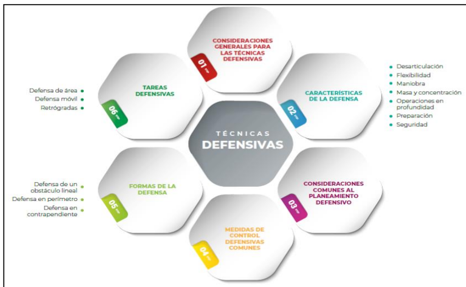
Figura 2 Técnicas defensivas contra amenazas híbridas.