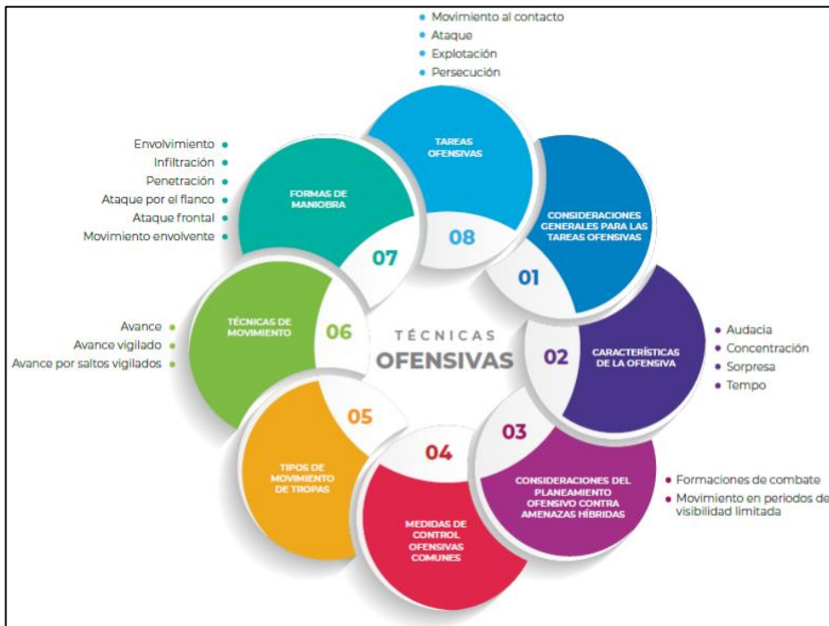
Figura 1. Técnicas ofensivas contra amenazas híbridas.