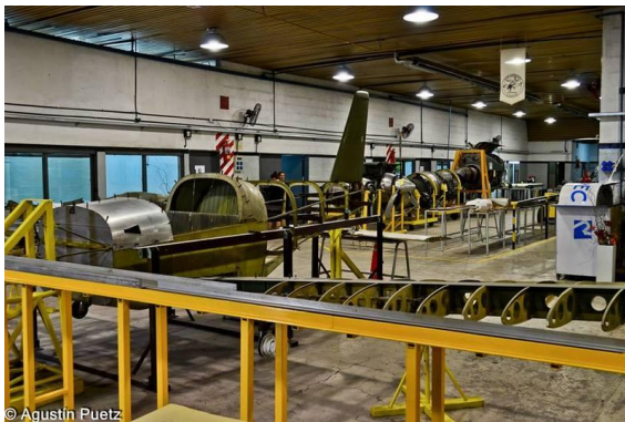
Figura 7: Vista del Taller – Fábrica de la Escuela Técnica.

La participación de los docentes y alumnos continuó en años posteriores asegurando la aeronavegabilidad continua de los aviones tanto a través de mantenimiento aeronáutico e inspecciones periódicas como de la introducción de modificaciones y mejoras que permitieron preservar a las aeronaves del mejor modo posible.