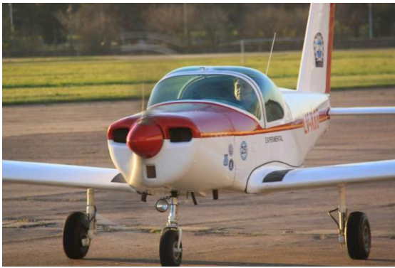
Figura 3: El Pazmany PL-2 rodando.

Se inició la fabricación del PL-4 como trabajo práctico final y luego de 170 días de actividad, el PL-4, matrícula LV-X86 levantó vuelo por primera vez desde El Palomar.