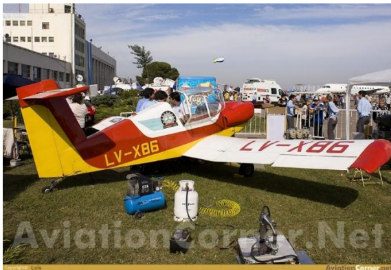
Figura 1 El Pazmany PL-4 en Argentina Vuela”.

De allí la oportunidad de difundir estas vivencias por medio de este trabajo, relatando los hechos y concluyendo con enseñanzas que puedan resultar de utilidad a otros protagonistas de la comunidad educativa en general, y aeronáutica en particular.