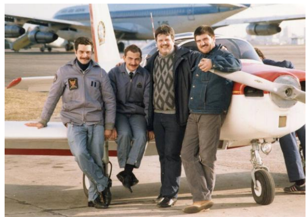
Figura 12: Profesores de la Escuela Técnica, tiempo atrás...