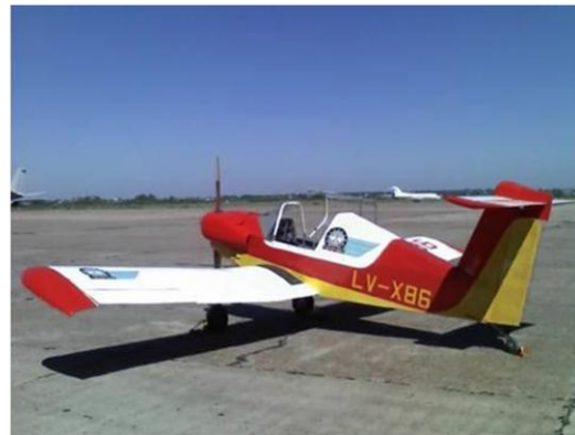
Figura 2: El Pazmany PL-4 en I Brigada Aérea.