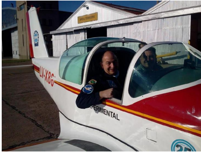
Figura 19: El Piloto de Pruebas y el autor de este trabajo.