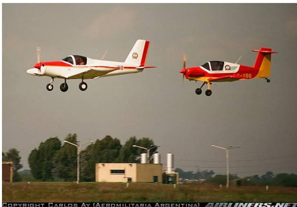
Figura 11: Pazmany's de la Escuela Técnica volando juntos.

Además, participaron de alumnos universitarios pasantes que acompañaron el desarrollo de proyectos de Investigación que exploraron las posibilidades de construir una aeronave sustentable dotada de motor eléctrico en lugar de uno convencional que consume combustible de origen fósil. Esta iniciativa elevó a docentes y a alumnos a un nivel realmente competitivo y superior, en las fronteras de la ciencia y la tecnología que los equiparó a aquellos centros de investigación aeronáutica en los que se desarrolla la movilidad aérea sustentable.