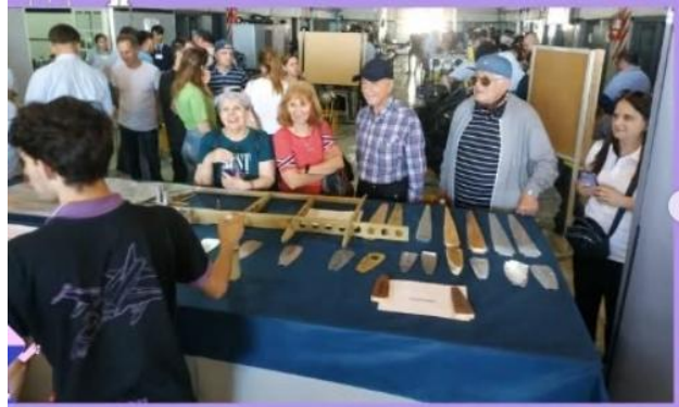
Figura 18: La Escuela recibe a familiares de alumnos.