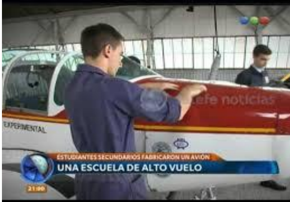
Figura 5: Captura de pantalla de una nota televisiva.