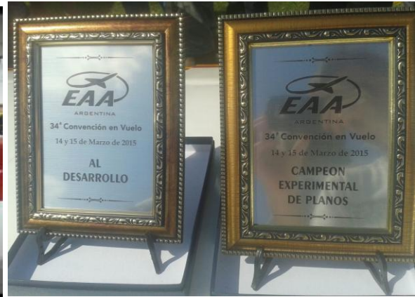
Figura 6: Algunos premios ganados por la Escuela Técnica.

La participación de los docentes y alumnos continuó en años posteriores asegurando la aeronavegabilidad continua de los aviones tanto a través de mantenimiento aeronáutico e inspecciones periódicas como de la introducción de modificaciones y mejoras que permitieron preservar a las aeronaves del mejor modo posible.