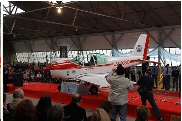
Figura 14: Presentación en sociedad del PL-2.

Este proceso explicó cómo puede mejorarse la formación de futuros profesionales, en el desarrollo de competencias científico-tecnológicas en el campo aeronáutico mediante el aprendizaje activo y colaborativo, donde el rol protagónico del estudiante es fundamental, y el docente es un guía/facilitador del conocimiento. Vale mencionar el carácter interdisciplinario que tuvo la construcción de aviones dada la naturaleza de los distintos sistemas que participan en la aviación.