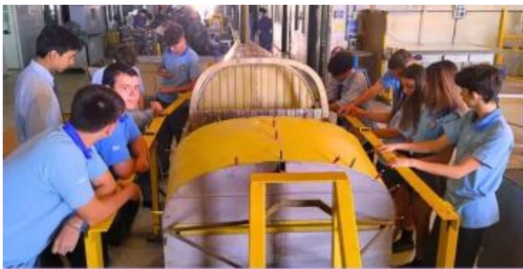
Figura 15: Los alumnos en clase de Taller.

La única forma de asegurar la presencia de esa virtud es enseñar, simultáneamente, a producir calidad. Lo que aún falta para cerrar el circuito completo es que exista un contexto laboral, industrial y aeronáutico que absorba a estos técnicos como mano de obra especializada para la producción de aeronaves, no ya como parte de un proceso académico de aprendizaje sino como lugar geográfico en donde la iniciativa privada y/o pública argentina invierte su capital de riesgo y todo su “know how” para incorporarse a la industria aeronáutica mundial.