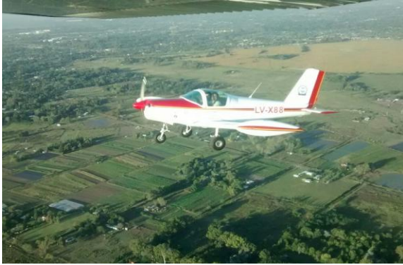
Figura 17: PL-2 volando sobre el Gran Buenos Aires.