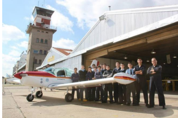
Figura 4: Profesor y Alumnos tras el Pazmany PL-2.

Más tarde, se decide redoblar la apuesta y construir otro avión de características superiores, el PAZMANY PL-2, biplaza de ala baja con tren de aterrizaje triciclo, motor de 115 HP. Se optó por este diseño pues ya había sido elegido y construido por más de 300 constructores amateurs en todo el mundo en forma exitosa. Se modernizó el taller y se incorporaron métodos más complejos de fabricación que los alumnos tuvieron oportunidad de aprender a usar.