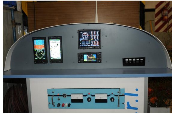
Figura 10: Mock up "Glass cockpit" experimental del PL-2.

Se pusieron en prácticas diversas iniciativas como el reemplazo de partes metálicas por otras de materiales compuestos, la introducción de métodos modernos de fabricación, etc., que hicieron que este proyecto tenga límites solo impuestos por la imaginación y tanto profesores como alumnos pueden ver la evolución de las tendencias más modernas en la aviación actual. Muchas de estas innovaciones se introdujeron en el avión biplaza como mejoras de actualización y puesta en valor.