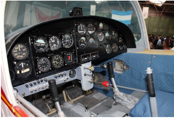
Figura 9: Interior y panel de instrumentos del PL-2.