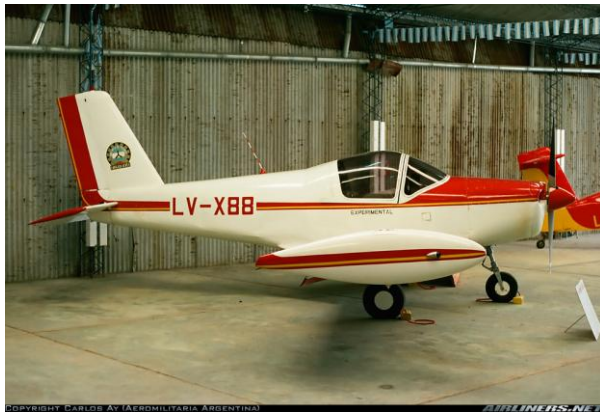
Figura 13: El Pazmany PL-2 descansando en el hangar.

Es compromiso de las autoridades de la comunidad educativa, obtener el apoyo necesario para asegurar la continuidad de este proceso para bien de todos sus actores y, por ende, de la educación, de la industria y de la aeronáutica en la Argentina.