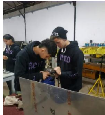
Figura 16: Aprendiendo a remachar.

Si logramos ésto, estaremos contribuyendo de manera más que efectiva a reforzar el sentido de la carrera de los egresados de las carreras aeronáuticas y otras afines al brindarles una oportunidad laboral en el contexto de la industria de fabricación de aeronaves en la Argentina, hoy, casi ausente.