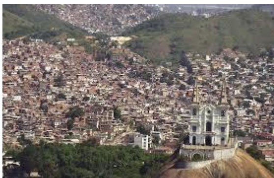
Figura 2 "Complexo de Favelas do Alemão e da Penha"

debido a las constantes tragedias naturales en su territorio, actuando no solamente en ayuda a las víctimas, como también en el combate a saqueos y violencia civil.