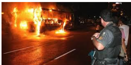
Figura 1 Colectivo incendiado por traficantes

La acción por parte de los Órganos de Seguridad Pública en la Región, exacerbó a los traficantes que desencadenaron, en noviembre de 2010, una serie de actos violentos contra la población, como el ataque a vehículos particulares, puestos de policías civiles y militares y a transportes públicos, creando un ambiente caos social para los habitantes de la ciudad. (Klinguelfus, 2012)