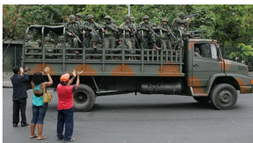
Figura 7 Aplausos a los militares por la población

Al estudiar el caso de la pacificación del “Complexo do Alemão e da Penha” se puede verificar que la salida del componente militar se dio con amplio éxito. Los Complejos fueron relevados inicialmente por policías del Batallón de Operaciones Especiales (BOPE) que vinieron a dar lugar a las UPPs. “Después de un año de ocupación de los “Complexos do Alemão e da Penha” por las Fuerzas de Pacificación, los índices de criminalidad disminuyeron. Según los índices suministrados por el Instituto de Seguridad Pública (ISP), a partir de una recolección de datos de comisarías policiales de la región, hubo una disminución del 9,1% en los casos de homicidios dolosos (con intención de matar), los robos a colectivos decrecieron 19,9% y a vehículos 44,3%. Sin embargo, la estadística más significativa, una vez que refleja directamente en la sensación de seguridad de la población, es a de reducción de robo al transeúnte. Este número cayó, prácticamente, a la mitad, de 1.380 para 768 21 .” (Klinguefus, 2012)