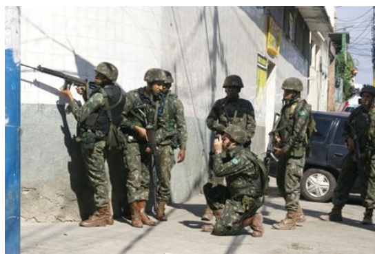
Figura 5 Cerco de la Brigada de Infantería Paracaidista

“Después de alcanzar los objetivos de la fase de intervención, habrá un equilibrio de acciones constructivas prevista para la fase de estabilización con actitudes coercitivas limitadas. Las fuerzas militares determinan esas acciones por medio de la identificación de las fuentes locales de inestabilidad. El componente militar ejecuta sus acciones de forma integrada al gobierno local (ambiente interno) o del país anfitrión (exterior) y en coordinación con los diversos actores presentes en el área de operaciones, para identificar las referidas fuentes que, si no fueran anuladas, pueden generar el recrudecimiento de la violencia”. (Estado-Maior do Exército, 2014). La intervención logró éxito recibiendo apoyo total de la sociedad civil, gobernantes y, principalmente, habitantes locales. No ocurrieron bajas ni fricciones entre los militares y la población local, preparando el terreno para la nueva fase que vendría a continuación.