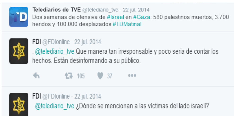
Figura 11: Actividades en twitter para mitigar efectos negativos en la opinión pública.