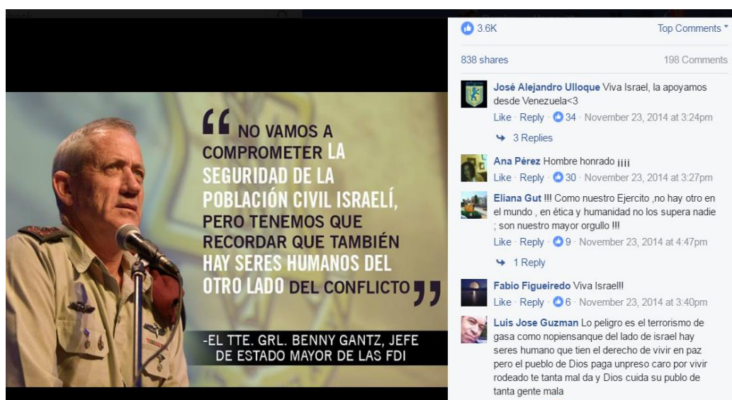
Figura 4 Mensaje del JEM de las FDI en un post de Facebook

“Mientras que luchamos por la seguridad de Israel, siempre tenemos en mente que del otro lado del conflicto también hay seres humanos”.