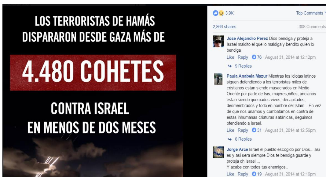
Figura 5 Publicación sobre los lanzamientos de misiles sobre Israel

Infografía publicada en Facebook con más de 3900 “me gusta”, compartida 2866 veces y con 308 comentarios al momento de consulta. La figura 5 expone los números de proyectiles lanzados hacia el Sur de Israel y asocia el mensaje: “ Hamás es culpable de al menos 4.480 intentos de asesinato de civiles israelíes inocentes. ¡Comparte! ”