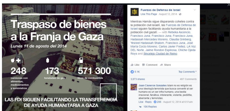
Figura 8 Publicación en Facebook sobre la ayuda de las FDI a la población gazatí

“Mientras Hamás sigue disparando cohetes contra la población civil israelí, las FDI siguen facilitando ayuda humanitaria a la población civil gazatí”