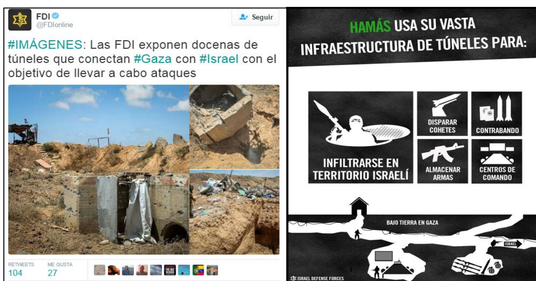
Figura 6 y 7 – Tuits e infografía sobre el sistema de Túneles de Hamas

La destrucción de esta amenaza se convirtió en uno de los principales objetivos de la Operación “Margen Protector”. La tarea fue responsabilidad del componente terrestre que ejecutaron un ataque contra el sector Este de la Franja de Gaza, desde donde las milicias de Hamás habían desarrollado una estructura defensiva desde donde, por medio de túneles, pretendían accionar contra las poblaciones y posiciones militares israelíes. Cuando comenzó la operación, la magnitud de la estructura de túneles sorprendió a las FDI, una red de 32 túneles subterráneos de ataque con múltiples ramas y salidas en diferentes fases de construcción, muchos destinados a penetrar profundamente bajo las fronteras de Israel, con la capacidad de facilitar el paso de cientos si no miles, de terroristas armados en una misión de masacre masiva contra el corazón de Israel (Hatzad Hasheni, 2015). Esto fue ampliamente informado por las redes sociales y blog oficiales de las FDI, como se puede apreciar en la figuras 6 y 7 donde se informa sobre las capacidades que le proporcionan lo túneles y qué tipo de amenaza representan. En los primeros días esta publicación en Twitter tuvo su repercusión con más de 100 tuiteos y fue compartido 27 veces.