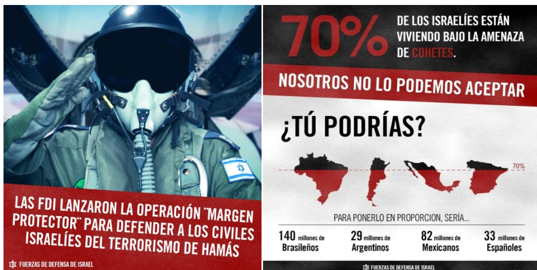
Figuras 1 y 2 - Infografía sobre la amenaza terrorista

Las acciones en las redes buscaban en primer lugar construir un vínculo que justifique el empleo de la fuerza armada como un método de autodefensa lícito y proporcional sobre los motivos y el desarrollo de la operación (Rodríguez Fernández, 2015), como se puede apreciar en la figura 1. Además de ello se utilizaban contenidos en búsqueda de la empatía personal y grupal, por tal motivo se difundían imágenes realizando comparando la situación de Israel con otros países, tal como lo muestra la figura 2.