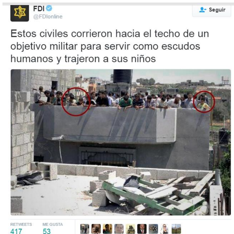
Figura 9 Tuit de las FDI sobre el uso de escudos humanos por parte de Hamas

Otro enfrentamiento de las narrativas tuvo lugar sobre el empleo de la población palestina como escudos humanos por parte de Hamás. Las FDI informaban que las milicias palestinas protegían sus instalaciones militares ubicándolos en proximidades de zonas protegidas y/o incitando a los civiles ante la amenaza de ataque. Esto fue confirmado el 8 de julio 2014 por el portavoz de Hamás Sami Abu Zuhri diciendo que la táctica de colocar a civiles en las estructuras que fueron blancos de Israel se había demostrado como muy positiva. Por tanto se registraron actividades en las redes para dejar en evidencia de la exposición de los civiles por parte de Hamás, ya sea para que sirvan para evitar acciones o utilizarlos como víctimas del ataque (Hatzad Hasheni, 2015).