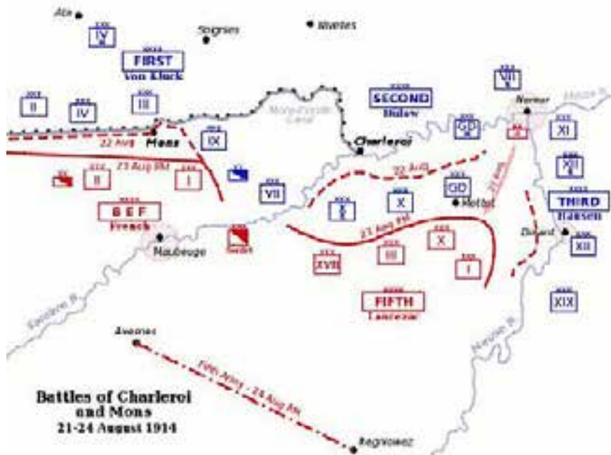
Gráfico General de la Situación Táctica:

El 21 de Agosto se inició la batalla de Charleroi, a 36 Km al Sur este de Mons, en la que los alemanes al mando de von Bülow derrotaron a los efectivos del ejército francés, comandadas por el General Lanrezac quien disponía en la región de 14 divisiones.